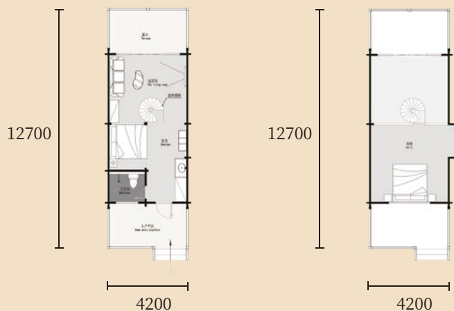
麓宿·星空木屋 (面积:47.7m 2 ) ▲